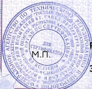
Схема сертификации 2.

Протокол выборочной проверки результата оказания услуг от 17.01.2025 № 204